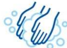
Thorough hand washing, gargling and disinfection