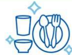
食器・トレイ・しゃもじ等の 消毒強化・徹底