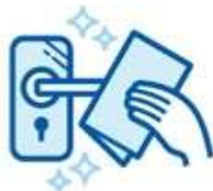
Disinfect the parts which are in contact with hands such as doorknobs, elevators, etc.