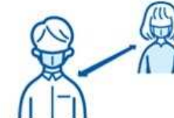
Ensuring social distance during work