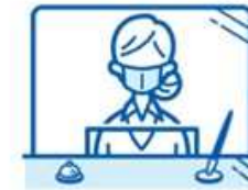
飛沫感染予防用 クリアカーテンの設置