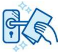
手に触れる箇所の消毒徹底 ※ドアノブ、エレベーター等