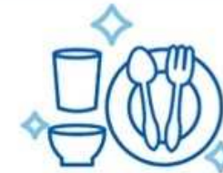
Enhanced disinfection of dishes, trays and rice scoop