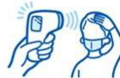
スタッフの体調チェック 37.0℃以上は出勤停止