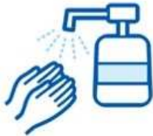
Installation of disinfectant