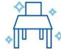
Disinfect chairs and tables thoroughly