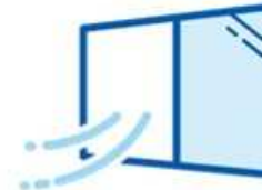
換気、扉開放の実施