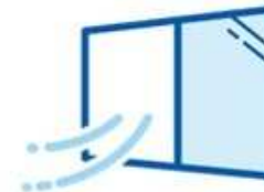
Ventilation and opening the windows