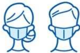
Wearing a mask at work