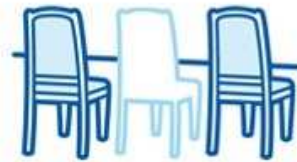
Expand the space between chairs