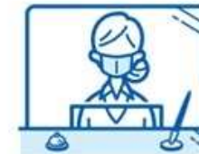
Installation of transparent sheets to prevent a droplet infection