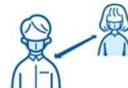
業務中の ソーシャルディスタンス確保