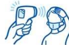
Checking the body condition of the staff Suspension of work in over 37.0 degrees