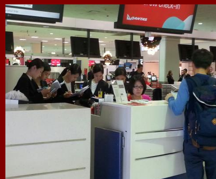
↑ 実際に現地で行われた研修の様子