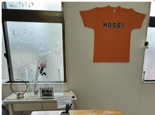
< 玄関 Entrance >