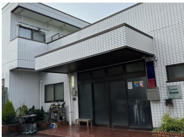
< 外観 External appearance >