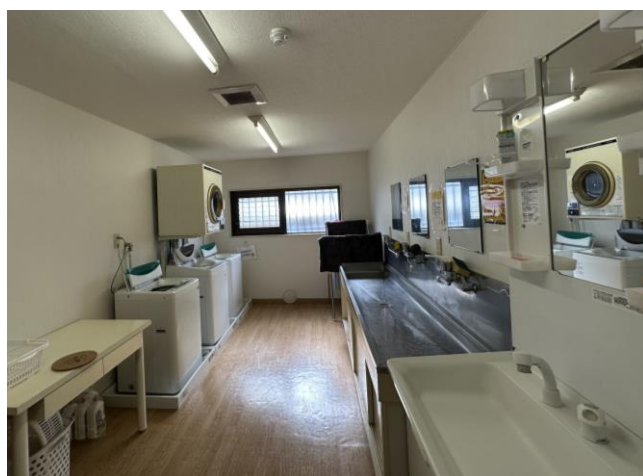
< ランドリー Laundry >