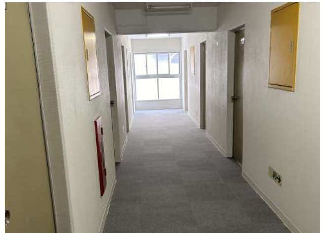
< 廊下 Corridor >