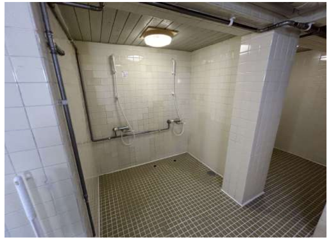
< 浴室内シャワー Shower in public bath >