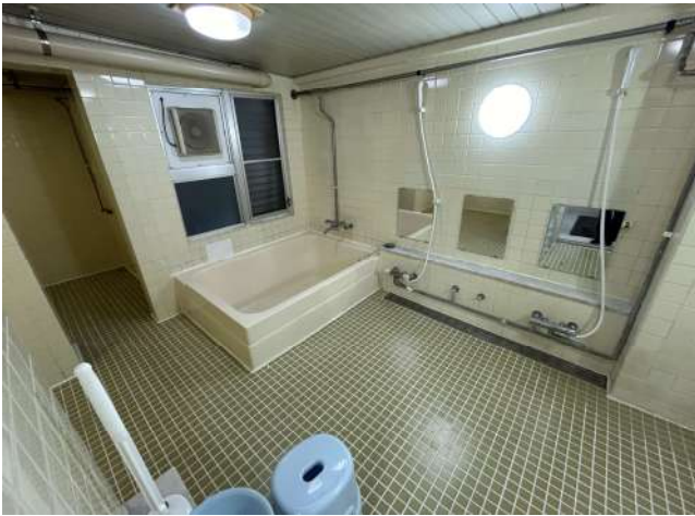
< 浴室 Public bath >