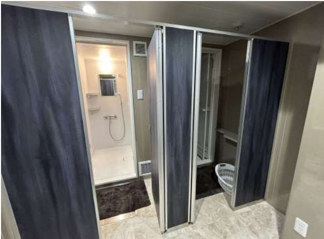
< プライベートシャワー Private shower room >