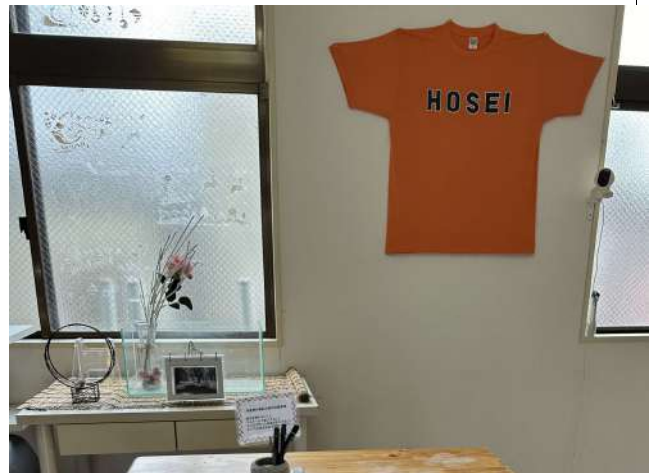
< 玄関 Entrance >