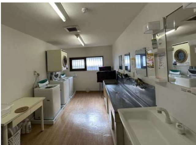
< ランドリー Laundry >