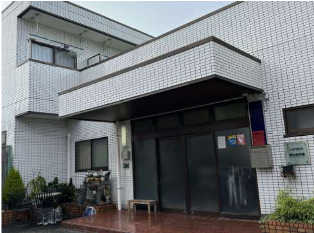
< 外観 External appearance >