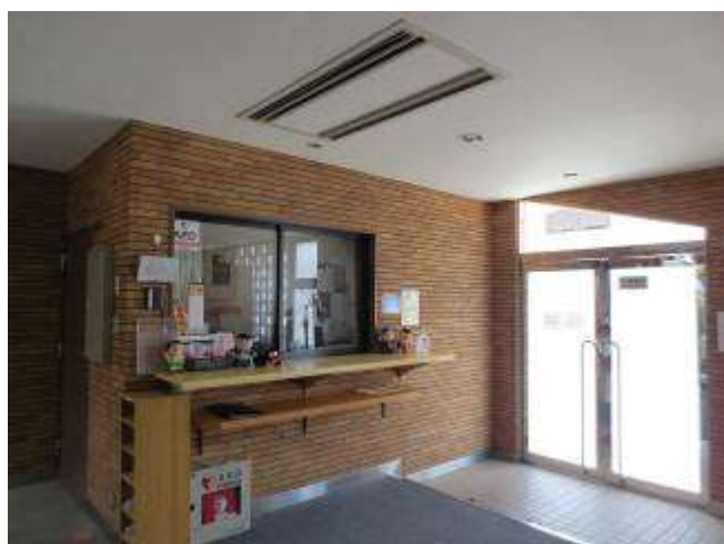
< 管理人室 Dorm manager's office >