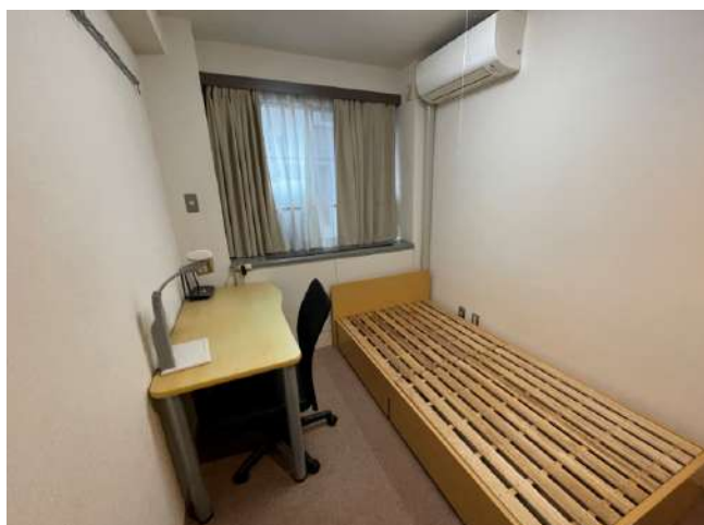
< 部屋 Room >