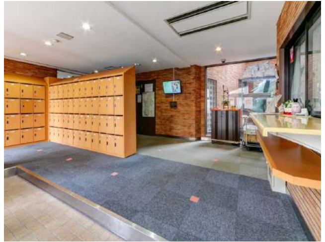
< 玄関 Entrance >