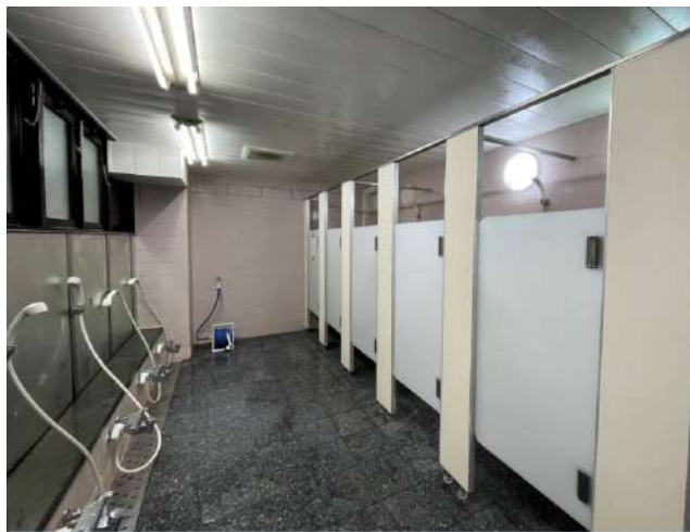
< 浴室内シャワー Shower room in public bath >