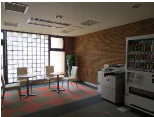
< ラウンジ Lounge >