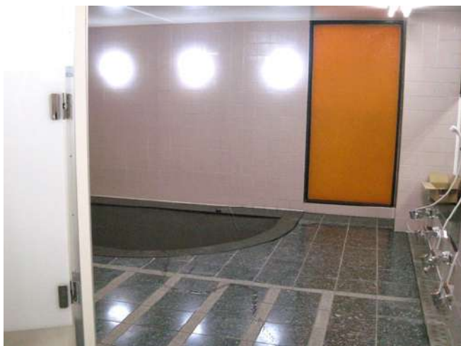
< 浴室 Public bath >