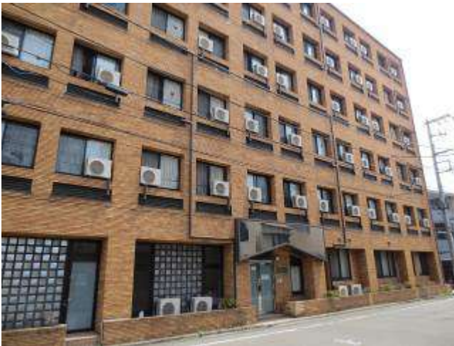
< 外観 External appearance >