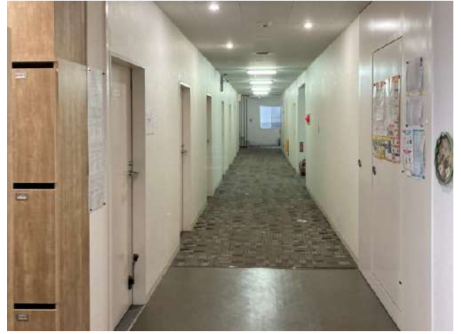
< 廊下 Corridor >