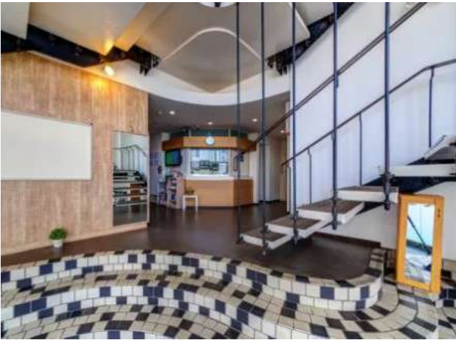
< 玄関 Entrance >