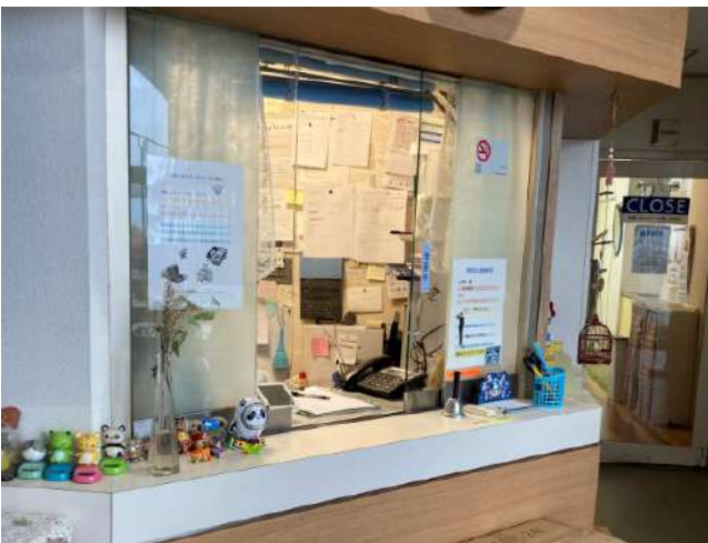
< 管理人室 Dorm manager's office >