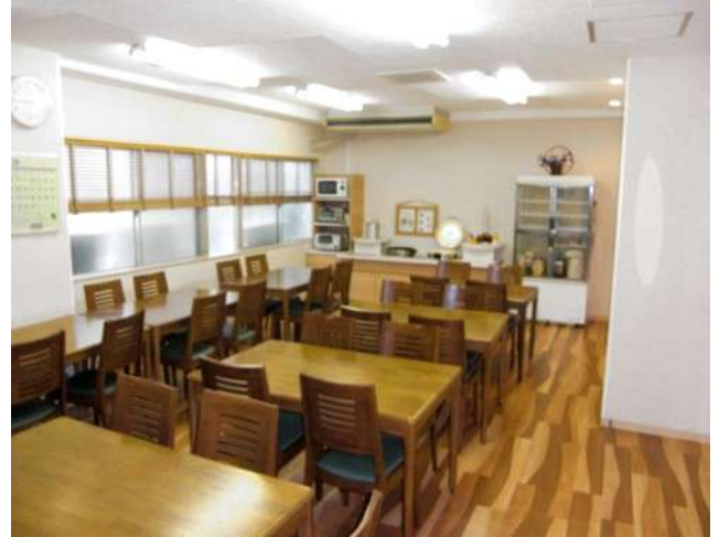
< 食堂 Dining room >