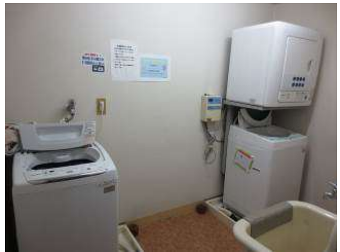
< ランドリー Laundry >