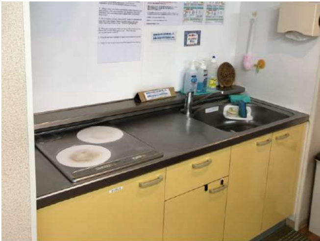
< キッチン Kitchen >