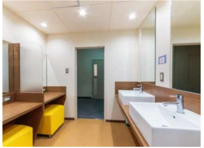
< パウダールーム Powder room >