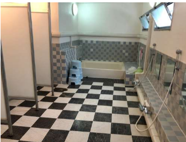
< 浴室 Public bath >