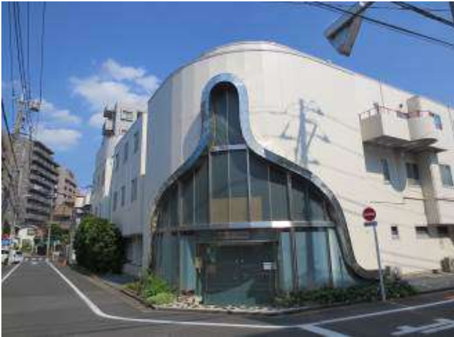
< 外観 External appearance >