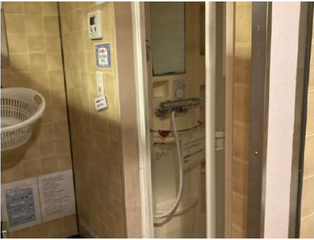
< プライベートシャワー Private shower room >