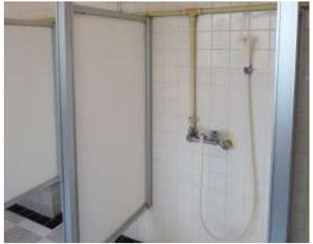
< 浴室内シャワー Shower in public bath >