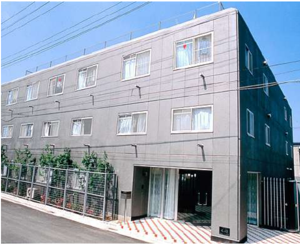
< 外観 External appearance >