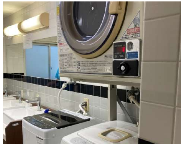
< ランドリー Laundry >