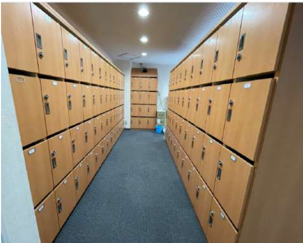
< 靴箱 Shoebox >