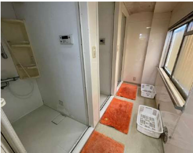
< プライベートシャワー Private shower room >