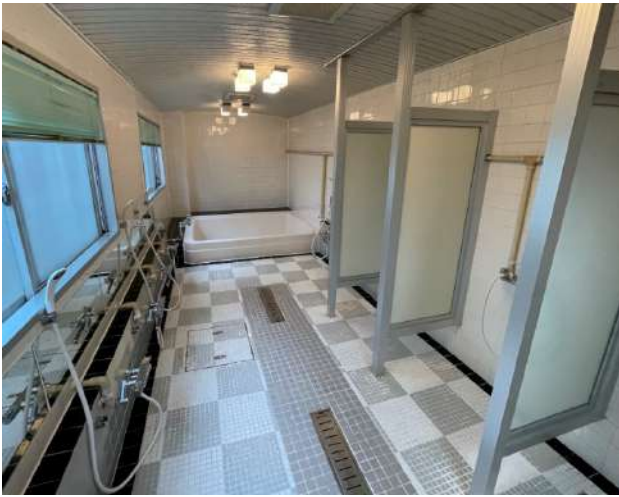
< 浴室 Public bath >