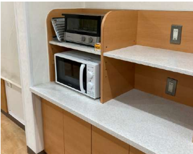
< 食堂 Dining room >