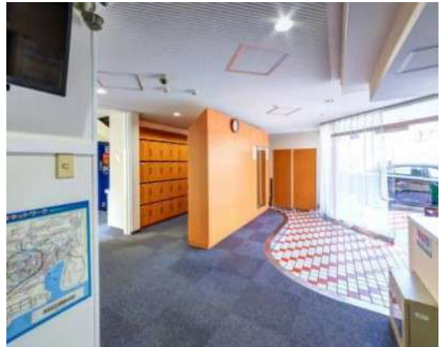
< 玄関 Entrance >