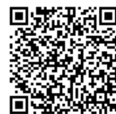
（ESOP ページ QR コード）