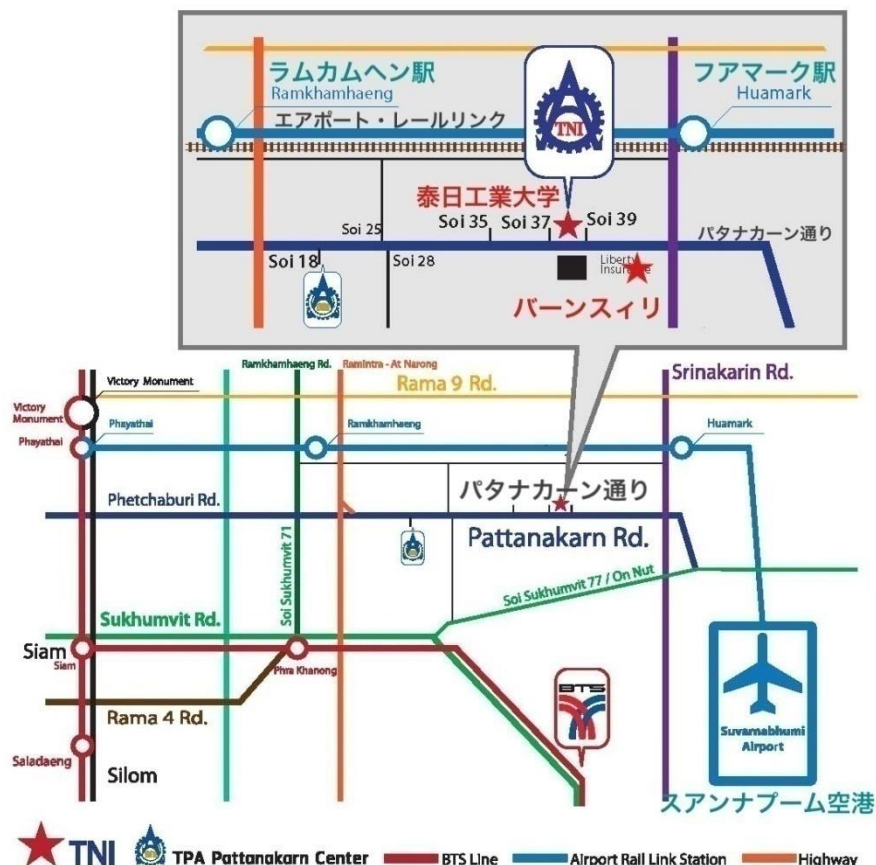
【泰日工業大学 (TNI) とバーンスイリの地図】